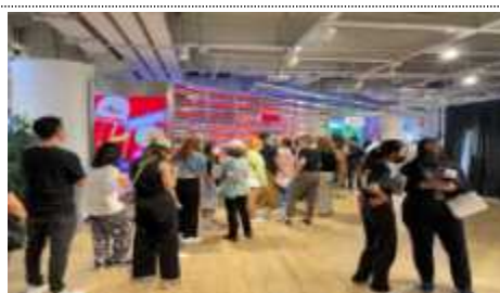
리테일 및 판매 공간