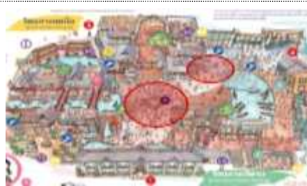
팝업스토어 위치 (642sqm,194평)