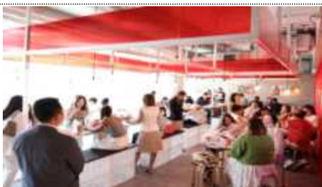
F&B 시식 공간