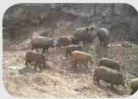
돼지 간 바이러스 전파가능